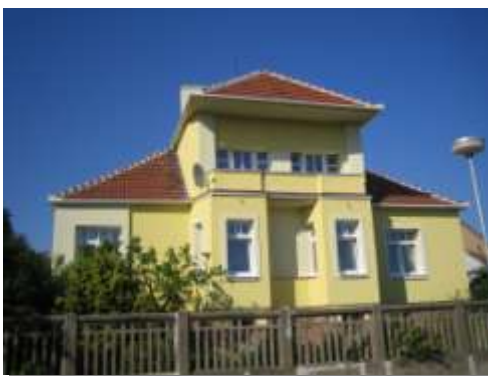
Zateplení RD v Tišnově Výměra: cca. 300m 2 , Systém: Ceretherm Premium Realizace: Jaro 2011, Cena: cca. 300.000,00Kč Investor: majitelé RD Certifikovaný systém pro program zelená úsporám.